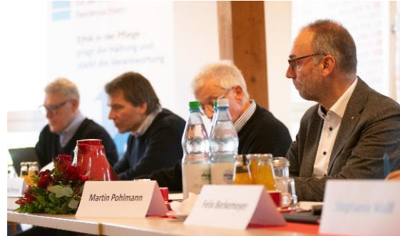
Abb. 4 & 5: Sitzung der Ethikkommission für Berufe in der Pflege Niedersachsen in Oldenburg