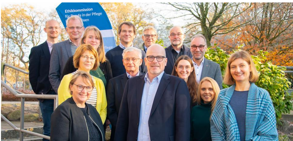
Abb. 1: Die Ethikkommission für Berufe in der Pflege auf ihrer Klausursitzung im November 2025 in Oldenburg.

Die Mitglieder der Ethikkommission üben ihre Tätigkeit unabhängig und nach bestem Wissen und Gewissen aus und sind zur Verschwiegenheit über alle Angelegenheiten verpflichtet, die ihnen im Zusammenhang mit ihrer Tätigkeit bekannt werden. Die Tätigkeit ist unentgeltlich. Die Mitglieder erhalten ein Sitzungsgeld von 15 Euro pro Sitzungstag als Aufwandsentschädigung sowie eine Erstattung der mit den Sitzungen verbundenen Reisekosten.