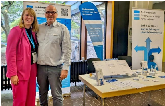
Abb. 6: Informationsstand ANP/APN Kongress