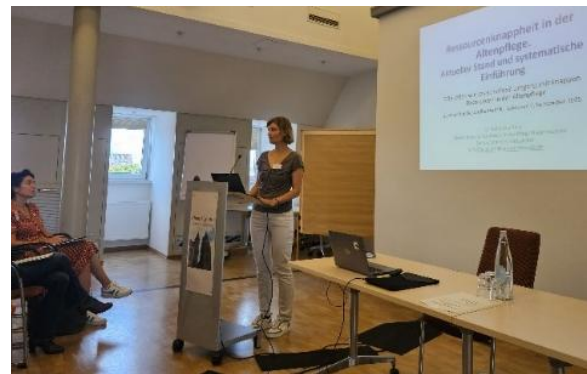
Abb. 7: Vorstellung Empfehlung, ZfG Hannover