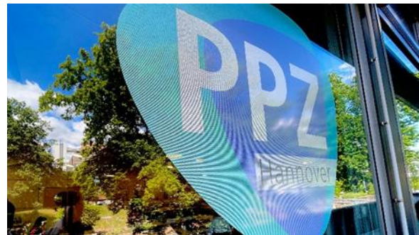
Abb. 2 & 3: Sitzung im Pflegepraxiszentrum (PPZ) in Hannover